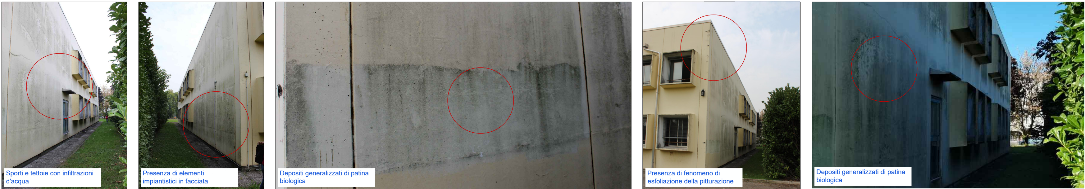
Viste esterne - Prospetto Nord