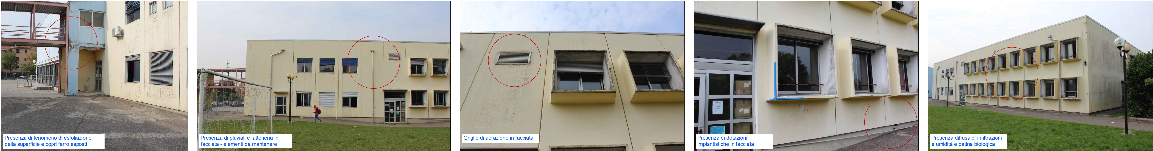
Viste esterne - Prospetto Est